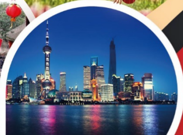
พระใหญ่หลังซานต้าฟอ