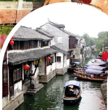
หมู่บ้านน้ำโจวจวง